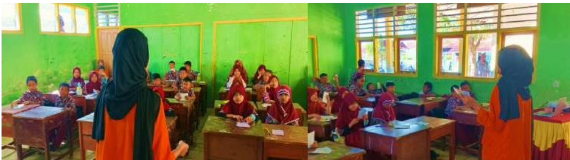
Gambar 1. Kegiatan One Day with Fun English

Kegiatan One Day with Fun English dilaksanakan di SDN 65 Penyandingan yang berlokasi di Jalan Pramuka Unsri No. 48, Desa/Kelurahan Penyandingan, Kecamatan Sosoh Buay Rayap, Kabupaten Ogan Komering Ulu, Provinsi Sumatera Selatan dirancang dengan pendekatan partisipatif dan interaktif yang melibatkan siswa secara aktif dalam proses belajar.