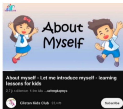
Gambar 5. Video pembelajaran “ about myself ”

Selanjutnya, fasilitator memperkenalkan cara introducing oneself dengan pemberian materi dan menayangkan video pembelajaran yang menampilkan contoh perkenalan diri dalam Bahasa Inggris melalui Kanal Youtube Glisten Kids Club. Video tersebut memperlihatkan kalimat-kalimat sederhana seperti “ My name is Tom ”, “ I am 7 years old ”, dan “ I live in London ”.