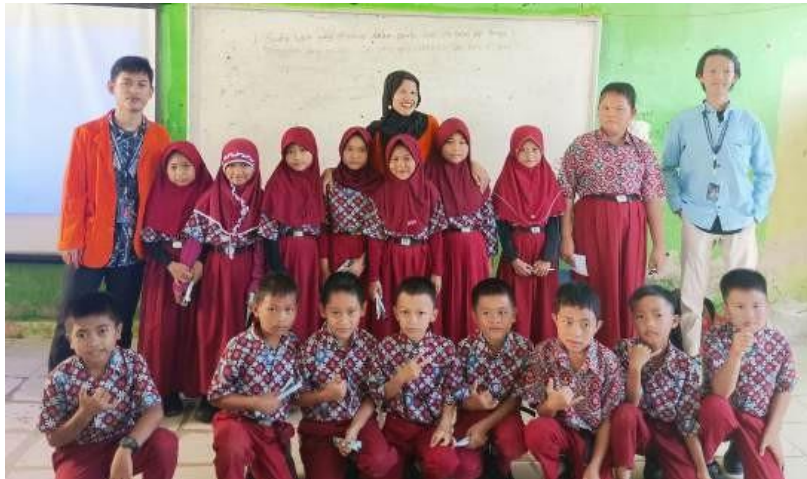
Gambar 8. Perwakilan Siswa Kelas VI SDN 65 Desa Penyandingan

Dengan hasil yang telah dicapai, kegiatan One Day with Fun English membuktikan bahwa metode pembelajaran Bahasa Inggris yang menyenangkan, interaktif, dan sesuai dengan karakteristik anak usia sekolah dasar dapat meningkatkan pemahaman dan minat belajar siswa secara signifikan. Kegiatan ini dapat menjadi model bagi pengembangan program serupa di masa depan, baik dalam skala lokal maupun regional, untuk memperkuat pembelajaran Bahasa Inggris di tingkat dasar dengan pendekatan yang lebih manusiawi, kontekstual, dan menyenangkan.