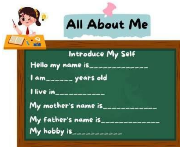
Gambar 6. Lembar kerja “all about me”

Sebagai bentuk latihan, siswa diminta untuk menulis biodata diri mereka dengan panduan yang telah disediakan dalam lembar kerja.