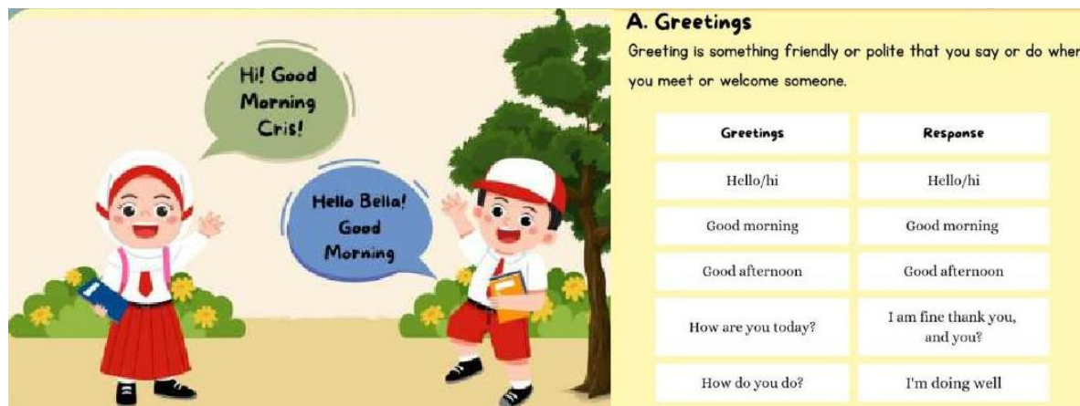
Gambar 2. Materi Greetings

Pada tahap ini, fasilitator memberikan salam pembuka dan memancing pengetahuan awal siswa mengenai Bahasa Inggris, khususnya kosakata salam seperti “ Good Morning ”, “ Good Afternoon ”, dan “ Good Afternoon ”. Hasil dari sesi ini menunjukkan bahwa hanya sekitar 10 dari 32 siswa yang mampu menjawab arti dari salam tersebut. Hal ini menunjukkan masih rendahnya pemahaman siswa terhadap materi dasar Bahasa Inggris.