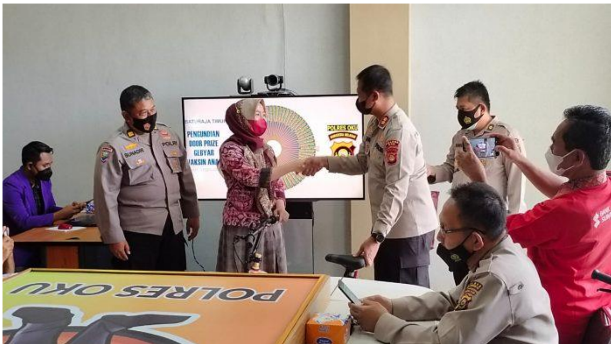
Gambar 2. Penyerahan Hadiah Door Prize

Untuk kelengkapan proses pengundian dan penyerahan hadiah yang diberikan langsung leh Kapolres OKU adalah sebagai berikut :