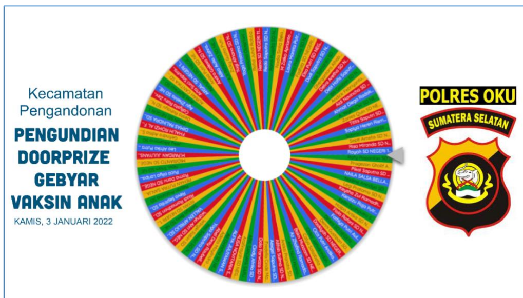
Gambar 1. Sistem Spin Pengundian Door Prize