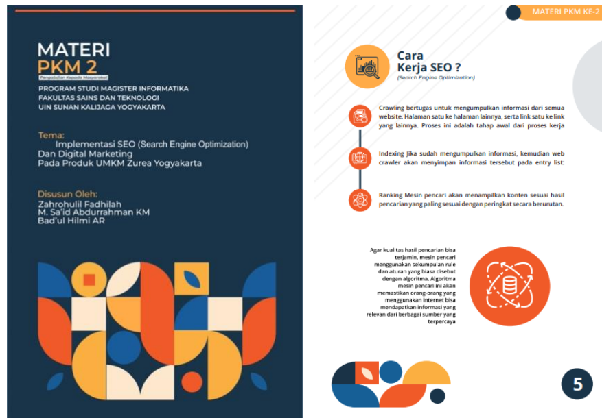
Gambar 3.2 Materi Pelatihan