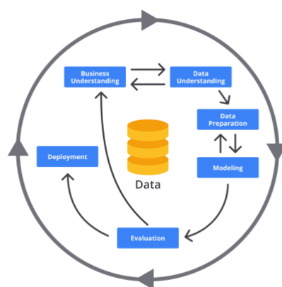
Gambar 1. Metodologi CRISP-DM

Penggabungan antara algoritma C4.5 dan metodologi CRISP-DM memberikan validitas yang kuat pada hasil penelitian. Tahap persiapan data dalam CRISP-DM sangat krusial, karena data akademik sering kali memiliki missing values atau format yang tidak seragam. Dengan mengikuti alur ini, peneliti dapat menjamin bahwa model yang dihasilkan benar-benar akurat dalam memprediksi faktor-faktor yang mempengaruhi IPK mahasiswa di Universitas Mahakarya Asia, sehingga hasil akhirnya dapat dipertanggungjawabkan secara ilmiah.